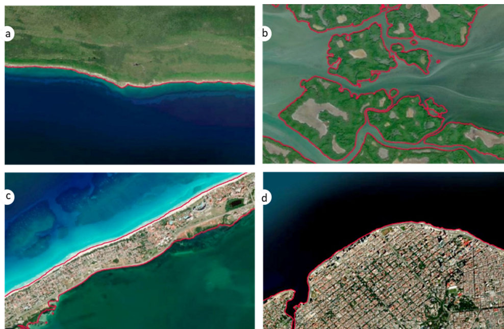
Figura 2. Ajuste del modelo sobre diferentes tipos de costas cubanas, para la escala 1:25000. a) rocosa, b) de manglar, c) arenosas, d) antropizadas